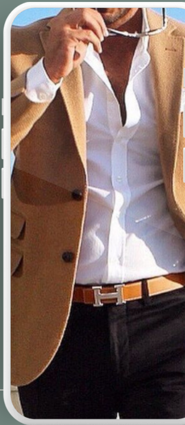
IMAGEN PERSONAL CONSCIENTE